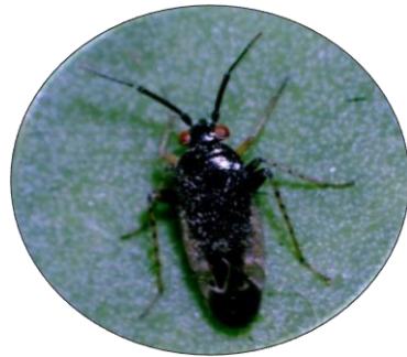
Chinche Proba sallei