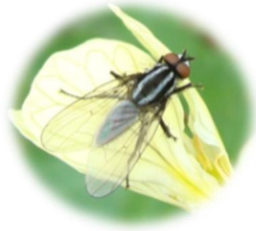
Barrenador del ápice ANTHOMYIIDAE