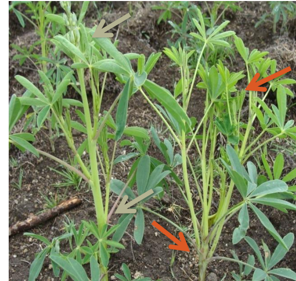
Barrenador del tallo Melanagromyza sp.