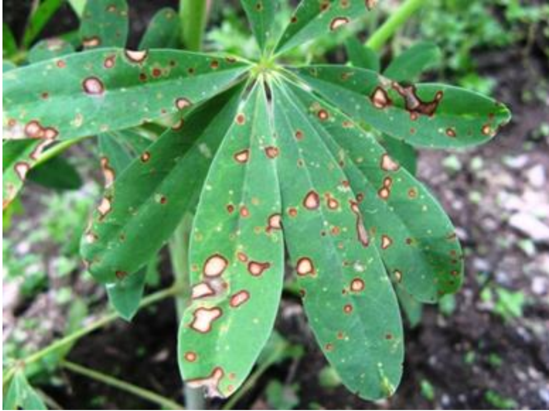
Mancha anular Ovularia lupinicola