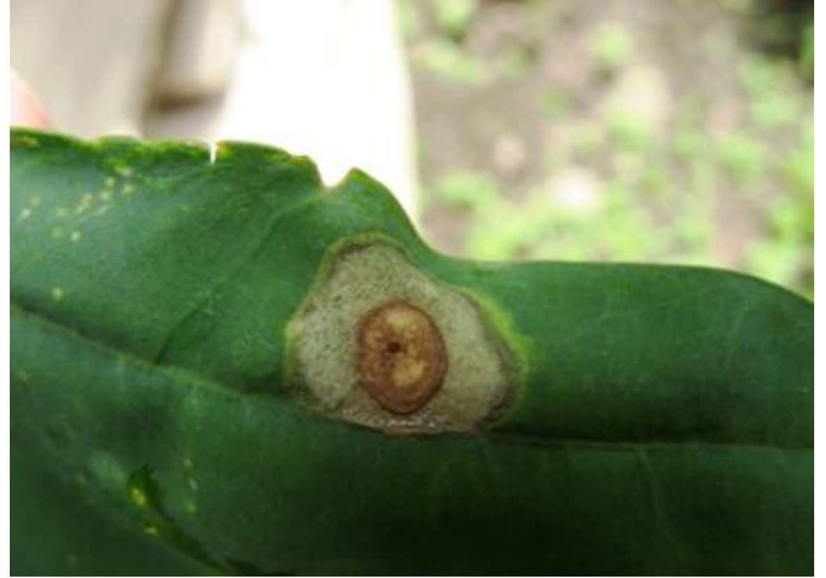
Cercospora Cercospora spp.