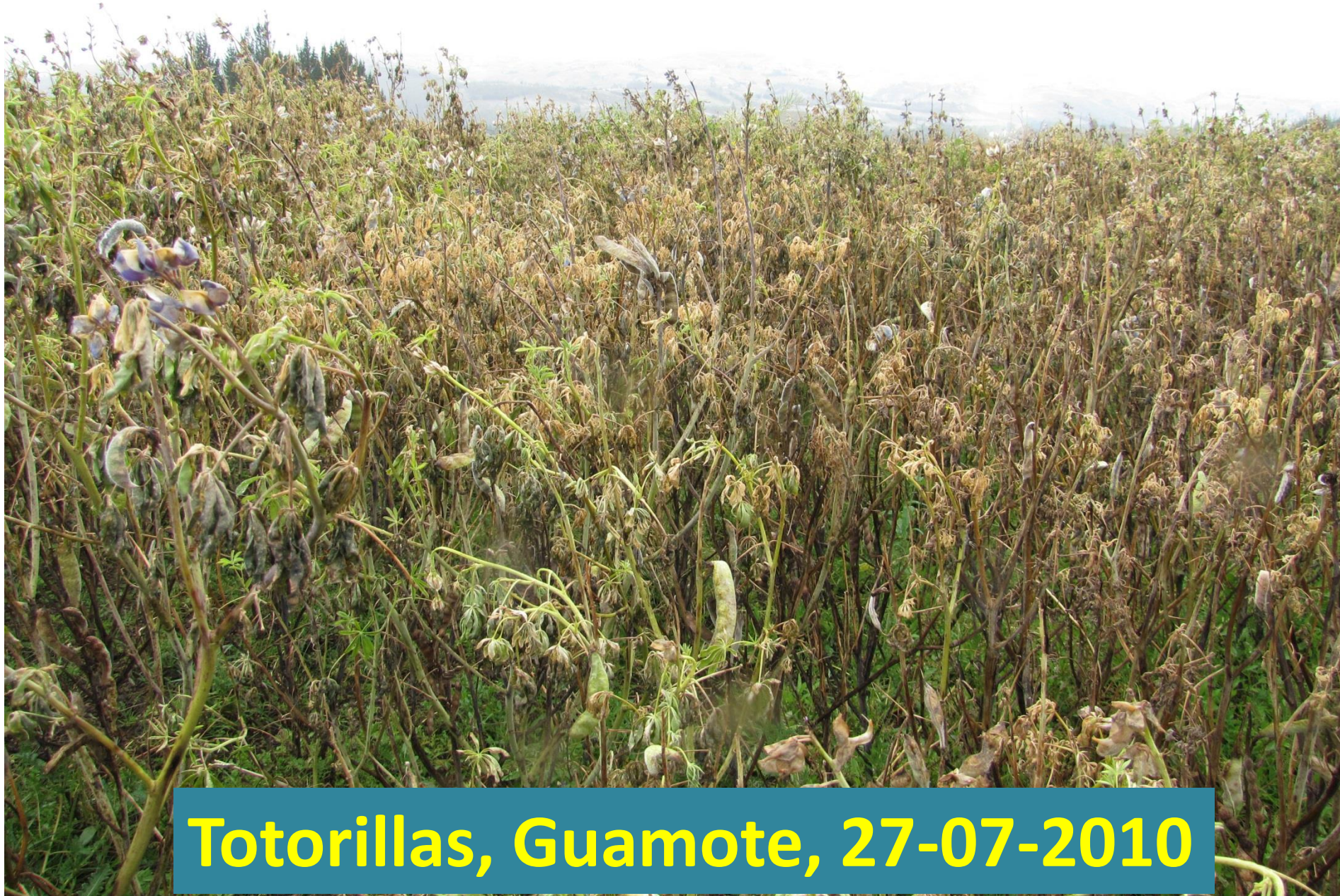
Totorillas, Guamote, 27-07-2010