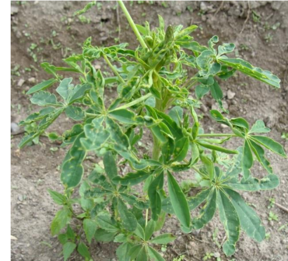
Mosca minadora Liriomyza sp.