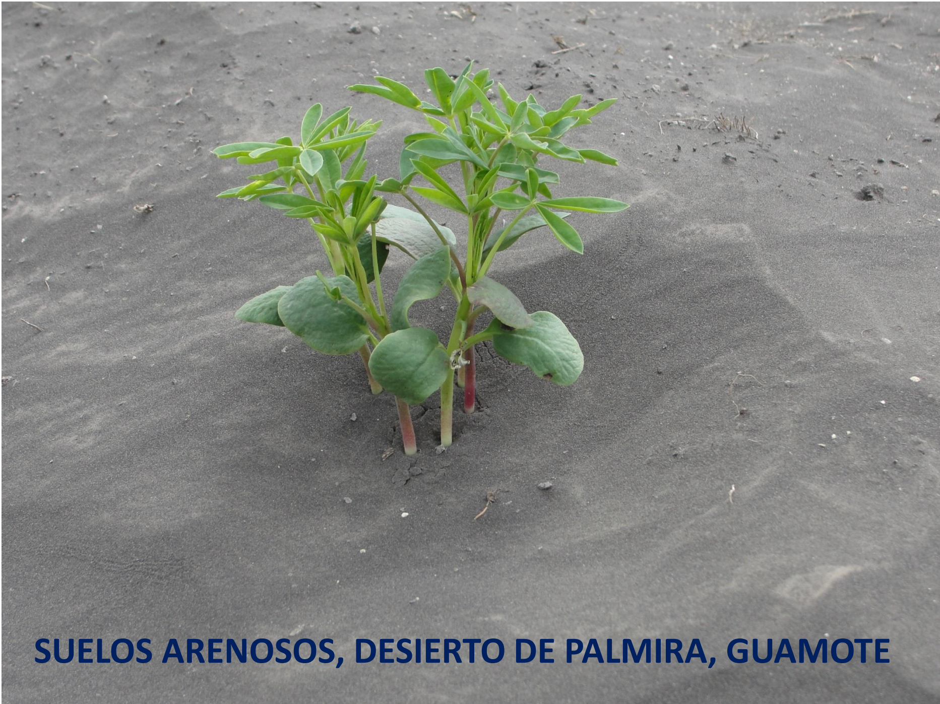
SUELOS ARENOSOS, DESIERTO DE PALMIRA, GUAMOTE