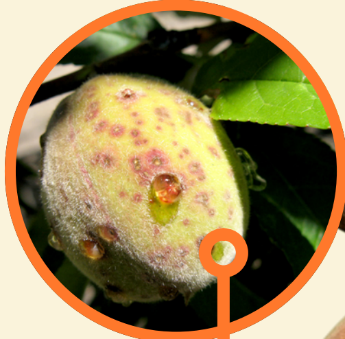
Manchas oscuras en los frutos