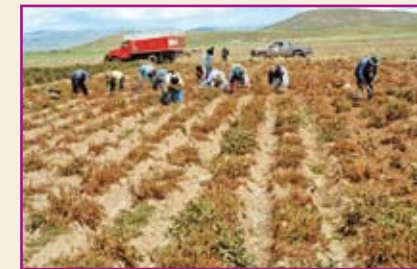
Agricultores realizando cosecha oportuna.

Debemos cosechar en su momento, caso contrario semana que pase, el daño será mayor. Si notamos algún daño en nuestra parcela, podemos adelantar la cosecha.