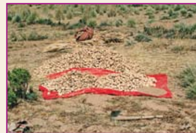
Papas amontonadas sobre plástico.