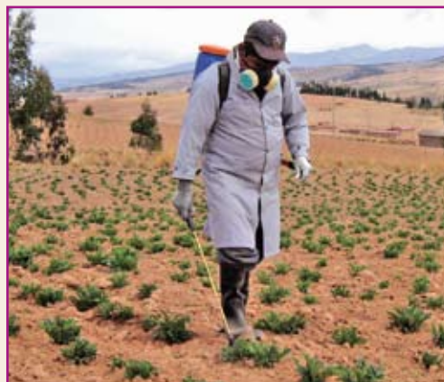
Aplicación de insecticida al cuello de la planta.

Debemos usar botas, guantes de goma, ropa que proteja todo el cuerpo y una tela para cubrirnos la nariz y la boca.