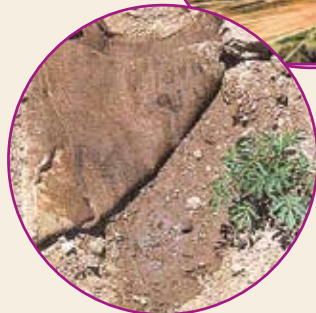
Trampa de yute.