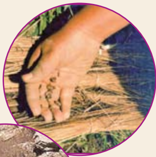
Trampa de paja.

Podemos colocar trampas de paja o yute cerca a las plantas de papa, así en el día los gorgojos se meterán debajo y los atraparemos fácilmente.