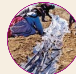
Zanja revestida de plástico.

Los gorgojos adultos salen de la tierra y caminan hacia las parcelas de papa más cercanas, por eso debemos hacer zanjas revestidas de plástico negro alrededor del almacén, para que caigan en ellas y los atrapemos fácilmente.