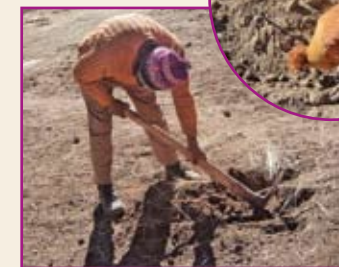
Agricultor removiendo la tierra.

Es bueno tener cerca a las gallinas para que se coman a las pupas y a los gusanos.