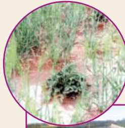
K'ipas de papa en una parcela de trigo.

Debemos eliminar las plantas k'ipas o plantas voluntarias que quedaron en nuestra parcela. Así evitamos que el gorgojo y otras plagas se multipliquen.