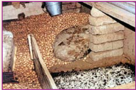
Aplicación de Bauvetop en almacén.

Para aplicar el Bauvetop, debemos remover la tierra del almacén a una profundidad de 5 centímetros. Luego humedecemos y mezclamos la tierra con Bauvetop (1 kg/m 2 ), finalmente apisonamos y colocamos las papas encima.