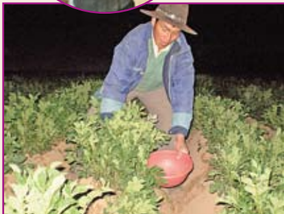
Recolección de gorgojos.