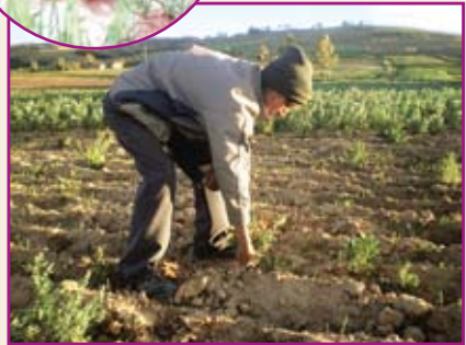
Agricultor eliminando plantas k'ipas.