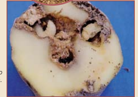
Pupa del gorgojo dentro de una papa.