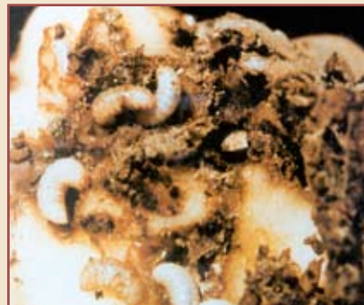
Papa con gusanos del gorgojo.