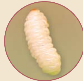
Gusano del gorgojo.

El gusano del gorgojo vive dentro de la papa más o menos ochenta días, antes de volverse pupa.