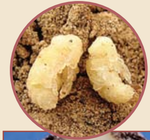
Pupa del gorgojo.

La pupa permanece dentro la papa hasta volverse gorgojo adulto, quedándose dormido hasta la próxima siembra