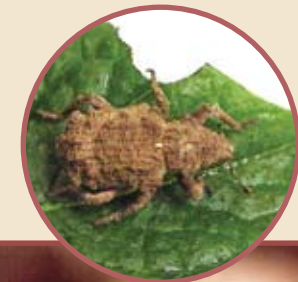
Gorgojo adulto comiendo una hoja de papa.

En el día se oculta debajo de terrones de tierra y piedras. En la noche sale a comer las hojas de la planta de papa, haciendo cortes en forma de media luna.