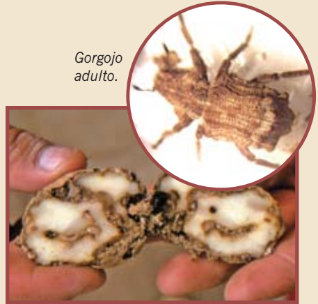
Papa dañada con gusanos del gorgojo.